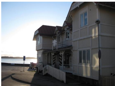
Strand Vandrarhem & Kusthotell

Kursen vänder sig till såväl nybörjare som till dig med erfarenhet av akvarellmåleri. Vi startar kursen på torsdagen kl. 13 och avslutar på söndagen kl. 16.